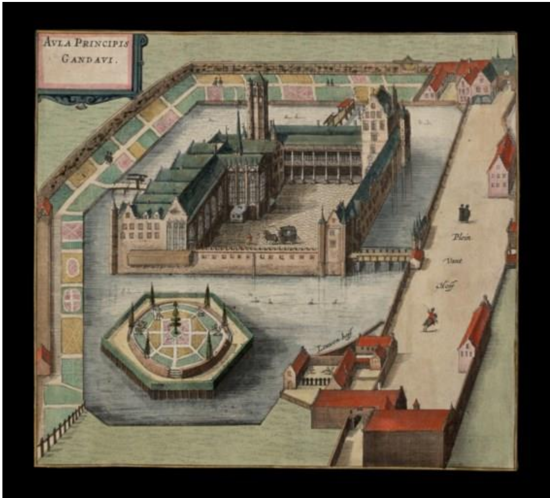
Het Prinsenhof op een historische afbeelding.