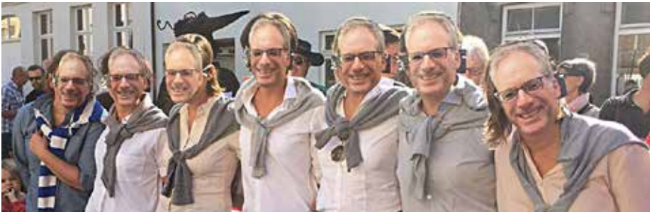
De Wouterettes - prinsenhoffeesten 2017

Stiekem hopen we dat Wouter het organiseren zo zal missen dat we hem nog af en toe te zien krijgen want wij zullen hem missen en niet alleen wij maar ook de Wouterettes en alle andere burens die tijdens de feesten eventjes lekker waanzinnig konden doen zonder enige gêne.