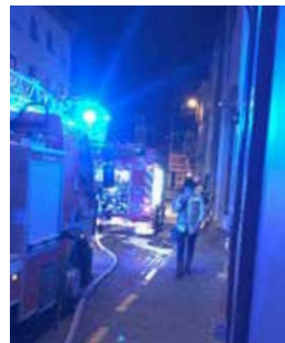
Brand in het Prinsenhof