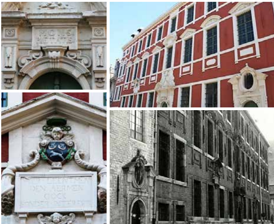
De Berg van Barmhartigheid in de Abrahamstraat

De Bergen van Barmhartigheid waren geen liefdadigheidsinstellingen. Men diende intrest te betalen. Toch werd het in Gent vanaf 1641 voor armen mogelijk geld te ontlenuen zonder de intrestverplichting. Dit kon dankzij een financiële schenking van bisschop Anton Triest (°1577 - †1657). Ook in dit geval dienden in ruil panden aangeboden te worden. Goud, zilver en juwelen werd, wat de armen betreft, niet aanvaard. In de voorgevel werd een gedenksteen aangebracht met het opschrift: “Hier leent men de aermen oock sonder interest” .