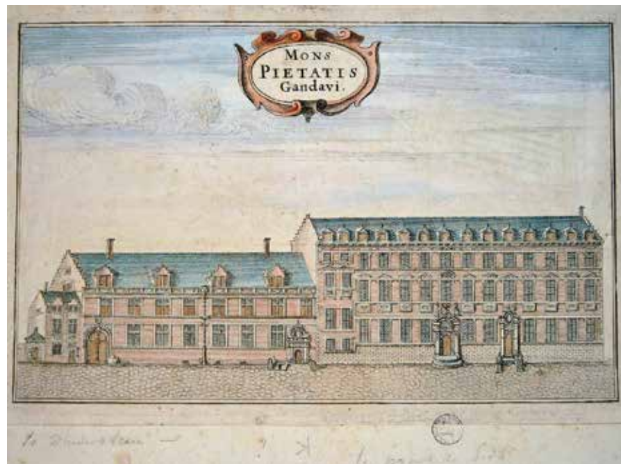
Berg van Barmhartigheid en woning van de beheerder, Abrahamstraat 13-15

Juwelen, goud, zilver en kostbare objecten werden in een afzonderlijke en stevig beveiligde kluis bewaard. Een intendant hield toezicht op de goede werking.