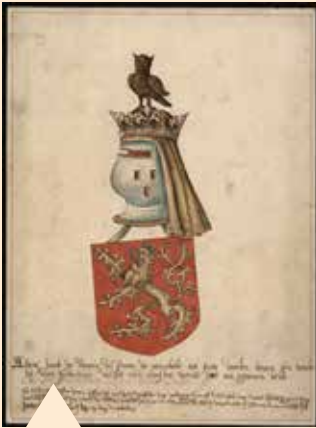
Wapenschild van de Mirabelle in de Sint-Veerlekerk