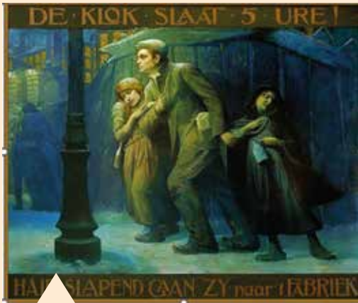
Iconische affiche van Achilles De Maertelaere

koppel schilderde hij een pendantportret. Schoonbroer Leon was onderwijzer en had zich tijdens de eerste wereldoorlog herhaaldelijk onderscheiden. Tijdens de tweede wereldoorlog was Leon actief bij het verzet. Hij wordt lid van het Geheim Legioen en begint al vanaf eind 1940 sluikbladen te verspreiden. Die werden vanuit Brussel naar Gent gesmokkeld door personeel van het transportbedrijf Steurbaut dat ook in de Prinsenstraat gevestigd was.